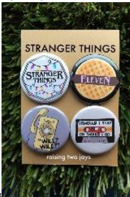
6/8 Stranger Things 4.62 € ACHETER