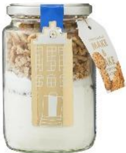
1/8 Gaufres Hollandaises 4.50 € ACHETER