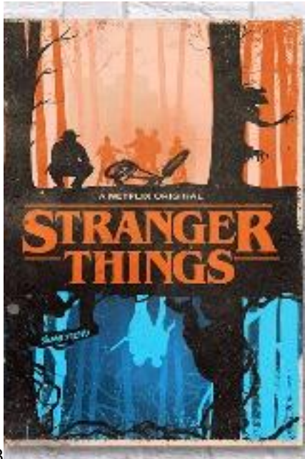
5/8 Stranger Things 5.71 € ACHETER