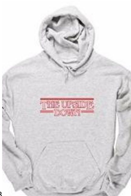
3/8 Stranger Things 17.55 € ACHETER