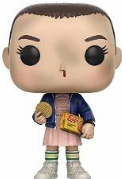
2/8 Eleven Stranger Things 7.96 € ACHETER