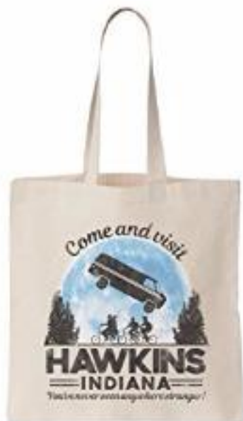
4/8 Stranger Things 8.99 € ACHETER